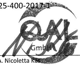
i.A. Nicoletta Kas Leitung der Zertifizierungsstelle Zertifizierungsstelle

Ausstellungsdatum: 03.01.2018 Zertifikatslaufzeit bis: 31.12.2018 Zertifikats-Nr.: 3825-400-2017-1